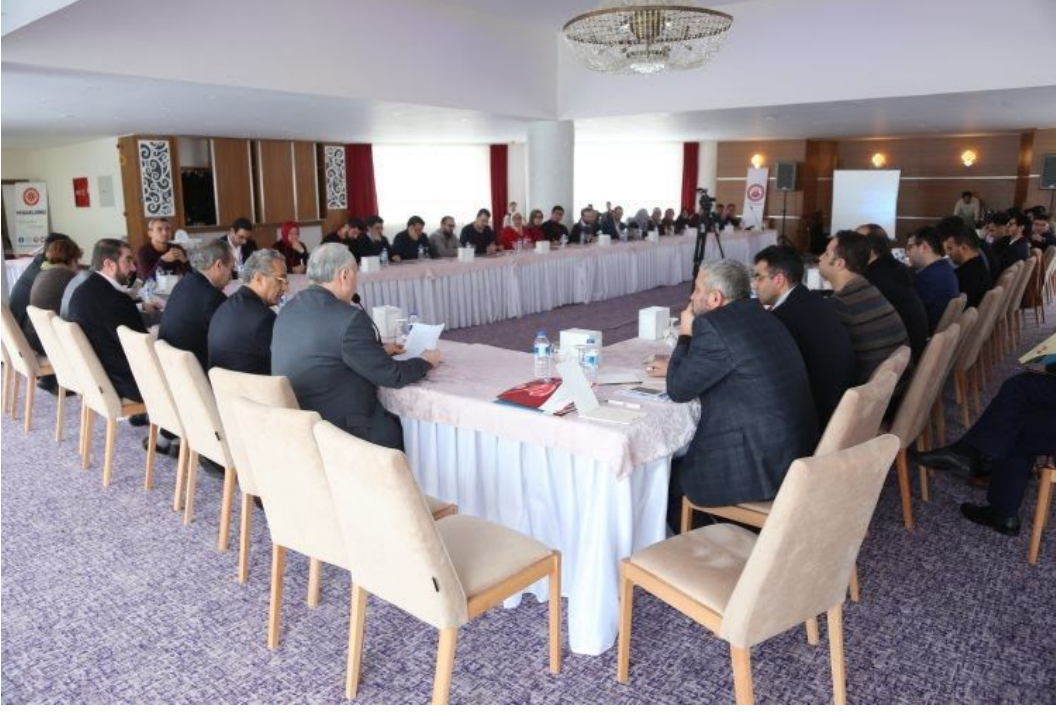
Görsel-3: İlahiyat Alan Dergileri Editörler Çalıştayı I (20 Ocak 2018)

Çalıştayda, 09:00-19:00 saatleri arasında hakemli dergi yayıncılığın mevcut durumu, sorun ve ihtiyaçları ile çözüme yönelik öneriler ele alınmış ve karara bağlanmıştır (bk. Çalıştay Kararları ). Çalıştayta oy birliği alınan otuz beş karar, Cumhuriyet Üniversitesi tarafından; YÖK, ÜAK, Üniversiteler ile ilgili kurum ve dergi editörlüklerine resmî yazı ekinde gönderilmiş ve alınan kararlar editörlükler tarafından büyük oranda uygulanmaya başlanmıştır (bk. Resmî Yazı ). Ayrıca editörlerin talepleri doğrultusunda sosyal ve beşerî bilimler alanında kullanılabilir şekilde ortak bir kaynak gösterme sisteminin geliştirilmesi çalışmalarına başlanılmış ve 2018 yılında İSNAD Atıf Sistemi geliştirilmiştir ( www.isnadsistemi.org ). Aralık 2020 itibari ile Türkçe, İngilizce ve Farsça olarak kullanımda olan İSNAD, yüksek lisans ve doktora tezlerinin yazımında 16 Enstitü, mezuniyet tezlerinin hazırlanmasında 6 Fakülte ve akademik yayıncılıkta 99 Hakemli Dergi tarafından kullanılmaktadır.