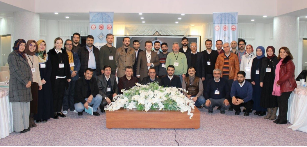
Görsel-4: İlahiyat Alan Dergileri Editörler Çalıştayı II (19 Ocak 2019)

Çalıştayda, 09:00-22:00 saatleri arasında hakemli dergi yayıncılığın mevcut durumu, sorun ve ihtiyaçları ile çözüme yönelik öneriler ele alınmış ve karara bağlanmıştır (bk. Çalıştay Kararları ). Çalıştayta oy çokluğu ile alınan yirmi sekiz karar, dergi editörlükleri ile ilgili kurum ve kuruluşlara sunulmuştur (bk. Resmî Yazı ). Kararların zaman içinde uygulanması ile ilahiyat alan dergilerinin ulusal ve uluslararası indekslerce dizinlenme durumlarında belirgin artış ve akademik yayıncılık kalitesinde ilerleme gözlemlenmiştir. Çalıştay sonrasında editörlerden ve ilgili kurumlardan gelen geri dönüşler ve talepler değerlendirilerek İSNAD Atıf Sistemi'nin ikinci edisyonu hazırlanmış ve Ekim 2019 itibari ile açık erişim olarak kullanıma sunulmuştur. İSNAD'ın yeni versiyonu, akademik çalışmalarda yaygın olarak başvuru kitap, makale ve tez gibi kaynaklara ek olarak sosyal medya mesajından nota kâğıdına varıncaya kadar kırk bir farklı veri türüne dair atıf ve kaynak gösterme kurallarını ve örneklerini içermektedir.